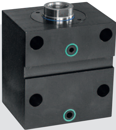
Abbildung: Hubstufe 2